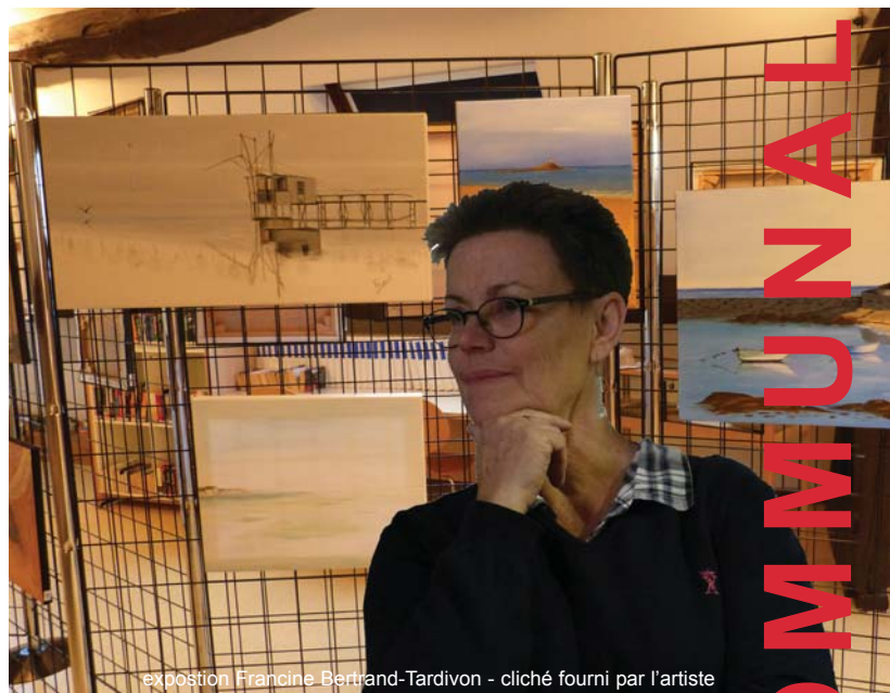
exposition Francine Bertrand-Tardivon - cliché fourni par l'artiste

Nous vous espérons toujours plus nombreux et sommes à votre écoute pour toutes vos suggestions.