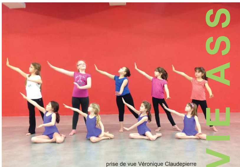
prise de vue Véronique Claudepierre

contact danse : Véronique Claudepierre, 06 17 15 31 73