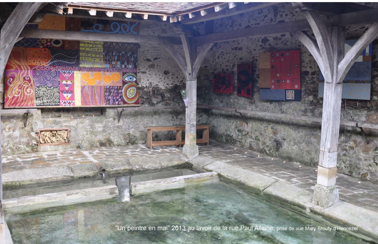
"Un peintre en mai" 2013 au lavoir de la rue Paul Allaine, prise de vue Mary Brouty d'Hennezel

Mary Brouty d'Hennezel 01 64 23 63 37 aaaassociés.hericy@voila.fr