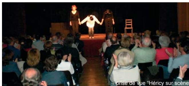
prise de vue "Héricy sur scène"

contact : Franck d'Ascanio 06 07 11 57 38