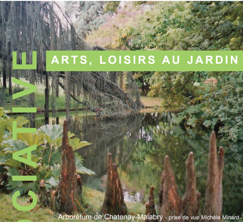
Arborétum de Chatenay-Malabry

Notre association fonctionne sur les communes de l'intercommunalité : Samoreau, Vulaines, Héricy pour le plaisir des amateurs de jardin, tant fleurs que potager.