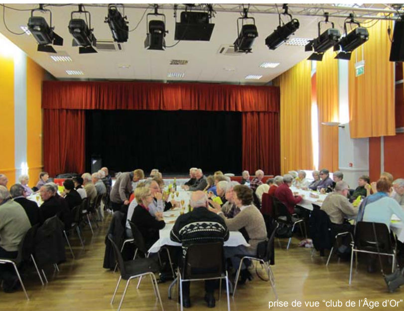
prise de vue "club de l'Âge d'Or"