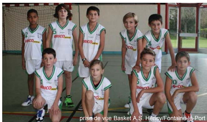
prise de vue Basket A.S. Héricy/Fontaine-le-Port