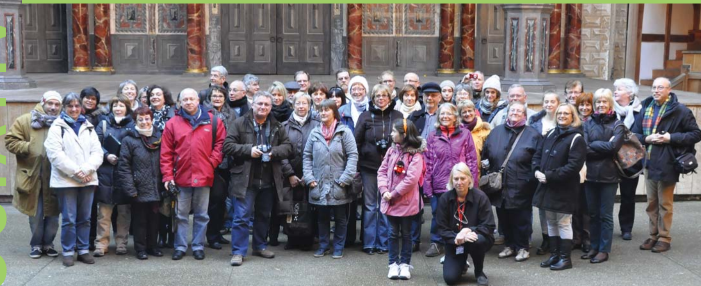
Au "Globe Theatre"